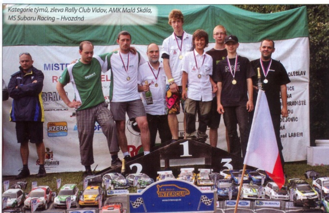
Kategorie týmů, zleva Rally Club Vidov, AMK Malá Skála, MS Subaru Racing – Hvozdná